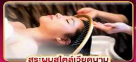
สระผมสไตล์เวียดนาม