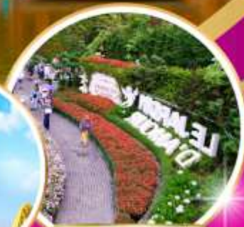
Le Jardin d'Amour