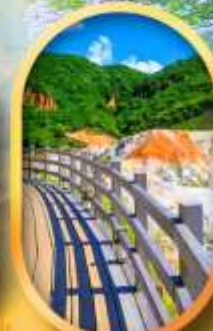
โนโบริเบ็ตสึ