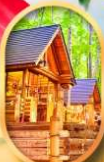
บึงเทิลเทอเรส