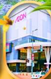
อโอมอลล์