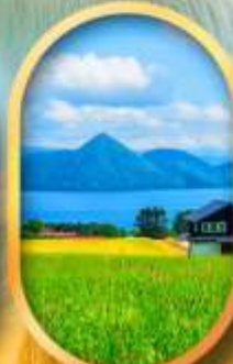
ทะเลสาบโทโยะ