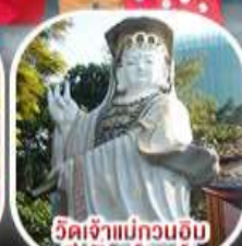
วัดเจ้าแม่กวนอิม รีพัลส์เบย์