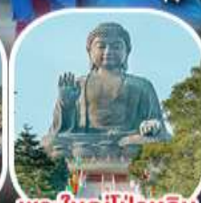
พระใหญ่ไผ่หวิน