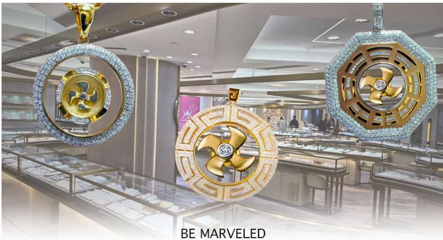
BE MARVELED ศูนย์อวรุญย์ กัณฑ์นครบุรี

และนำท่านชม ศูนย์ปี่เข้ะ ซึ่งคนจีนนั้น ถือว่าหยกเป็นหิน ที่เป็นตัวแทนของความสวยงามและความบริสุทธิ์มีความเชื่อว่าหยก มงคล ถ้าพกติดตัวไว้จะอายุยืนและสุขภาพดีมีสินค้ามากมายเกี่ยวกับหยก อาทิ กำไลหยก หรือสัตว์นำโชคอย่างปี่เข้ะ ให้ท่าน ได้เลือกซื้อเป็นของฝาก, ของที่ระลึก หรือของนำโชคแต่ตัวท่านเอง