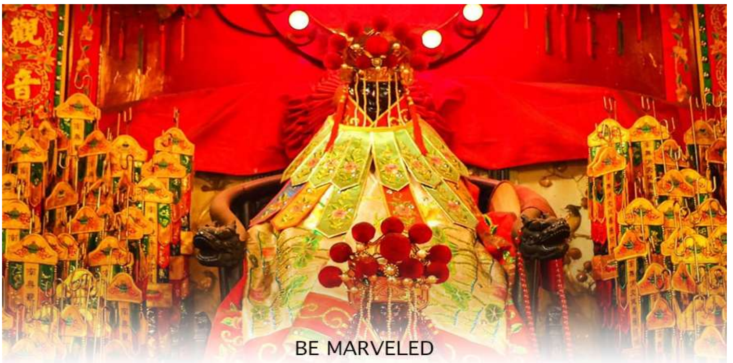
BE MARVELED วัดเจ้าแม่กวนอิมสองอำ (ยิมฮิน)

จากนั้นนำท่านสู่ เจ้าแม่กวนอิม วัดสองอำ (HUNG HOM KWUN YUM TEMPLE) เป็นหนึ่งในวัดที่เก่าแก่ที่สุดของฮ่องกง และชาวฮ่องกงเลื่อมใสกันมาก สร้างขึ้นในปี ค.ศ.1873 ในสมัยช่วงสงครามโลกครั้งที่ 2 มีการปล่อยระเบิดลงบริเวณใกล้กับวัดแห่งนี้หลายต่อหลายครั้ง ทำให้มีผู้บาดเจ็บและล้มตายมากมาย แต่ชาวบ้านที่หนีเข้าไปหลบภัยในวัดนี้ก็กลับปลอดภัยอย่างปาฏิหาริย์ และตัววัดก็ไม่ได้ได้รับความเสียหายจากเหตุการณ์ที่ระเบิดอย่างน่าอัศจรรย์ ตามความเชื่อของคนจีนใน ฮ่องกง-มาเก๊า จะมี "วันเปิดทรัพย์" หรือ "พิธียืมเงิน เจ้าแม่กวนอิมฮ่องกง" เป็นวันที่จะมาขอพรและยืมเงินเจ้าแม่กวนอิม ซึ่งนับจากหลังวันตรุษจีน ไป 26 วัน จะเป็นวันเปิดทรัพย์ที่จัดขึ้นในทุกๆปี พิธีนี้จะมีเพียงครั้งปีละครั้งเท่านั้น เป็นวันสำคัญอีกวันที่คนหลังไหลมาไหว้ขอพรอย่างไม่ขาดสาย