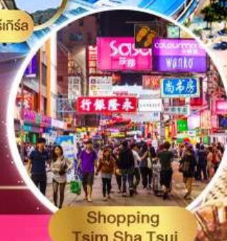
Shopping Tsim Sha Tsui