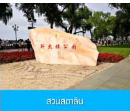
สวนสตาลิน