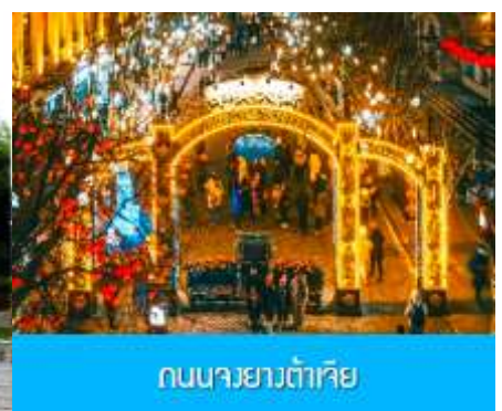
ถนนจงยั้งลู่