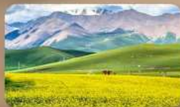
ทุ่งหญ้าซีเหลียน