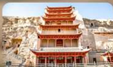
กำม่อเกาคู