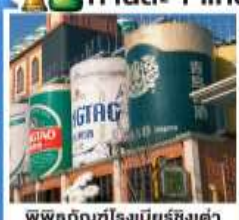
พิพิธภัณฑ์เบียร์ชิงต้า