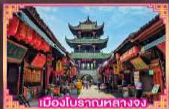
เมืองโบราณหลางจง