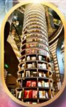
หอหนังสือจุงชูก่อ