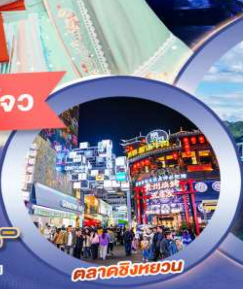
ตลาดซิงหยวน