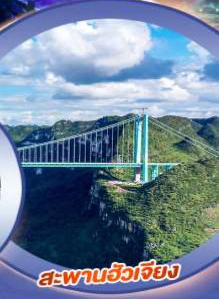
สะพานฮัวเจียง