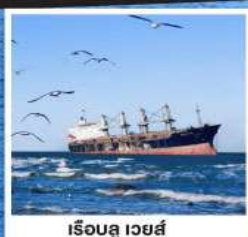
เรือลู่เว่ยซี่