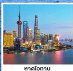
หาดไวทาน