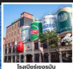
โรงแรมริเวอร์มัม