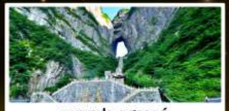
อุทยานประตูสวรรค์