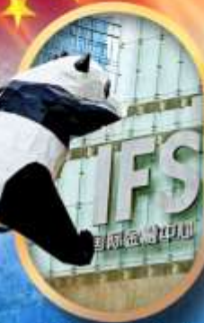
IFS หมีแพนด้าป็นตึก