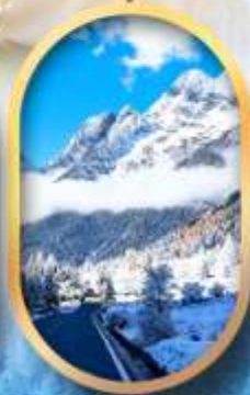
อุทยานสี่ครุณี