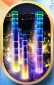
SKP Global Center