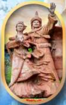
เมืองโบราณซงฟา