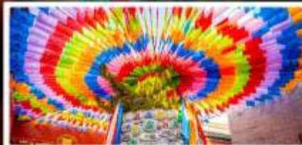
วัดลามะกว้างเหิน