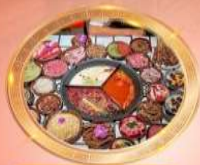
บุฟเฟต์หมีโพงซิ่ง